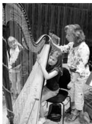
Die Schülerinnen und Schüler waren von dem Konzert restlos begeistert...