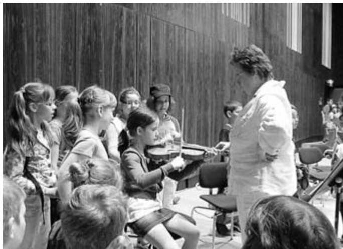
... einige Musikinstrumente auszuprobieren.

Blut fließt. Er beschreibt in seinem Tongedicht ein historisches Ereignis, nämlich als französische Siedler mit ihren Schiffen an der mexikanischen Küste landen und dort auf dem Gebiet der Karankawa-Indianer ein Fort errichten. Doch bald sind die Siedler umzingelt und es beginnt ein mörderischer Kampf zwischen ihnen und den Indianern. Dies alles kam in der Musik zum Ausdruck. Die Schüler waren restlos begeistert von dem Konzert „Indianer“ und folgten gerne der Aufforderung der Orchestermitglieder im Anschluss an die Vorstellung einzelne Instrumente auszuprobieren. Weitere Fotos auf unserer Homepage: http://gslosheim.de/aktuelles/schuljahr-2011-12