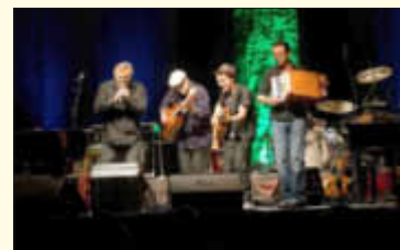
Konstantin Wecker & Band

Am Freitag, dem 5. Juli gastiert Konstantin Wecker mit seiner Band im Eventgelände am Stausee Losheim. Er präsentiert sein neues Liebe-Programm unter anderem mit Titeln seiner neuen CD »Wut und Zärtlichkeit«. Der Liedermacher, der die deutsche Musikszene seit über 4 Jahrzehnten mitprägt, ist sich selbst immer treu geblieben und wird so auch auf seiner aktuellen Tour den Menschen wieder Mut machen, sich zu empören. Oder ganz einfach Mensch zu bleiben. Dies tut er mit wütenden und zärtlichen Tönen sowie traumhaft schönen Melodien. Karten bei der Tourist-Info am See, sowie allen Vorverkaufsstellen von www.ticketregional.de