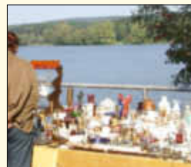
Antik- und Trödelmarkt

Der Markt ist jeweils von 10.00 bis 18.00 Uhr geöffnet. Infos und Anmeldung beim Veranstalter Saar-Pfalz-Märkte Tel. 0151/17274335