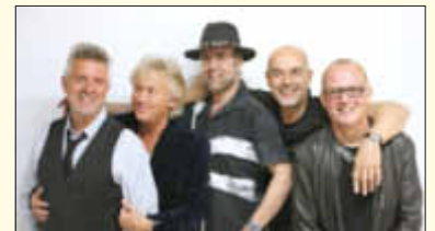
Manfred Manns Earth-Band

Karten ab 34,90 EUR bei der Tourist-Info am Stausee sowie allen Vorverkaufsstellen von www.ticketregional.de