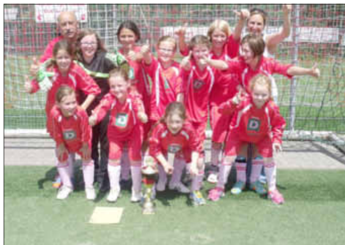
Die siegreiche Fußball-Mädchenmannschaft der Grundschule Losheim.