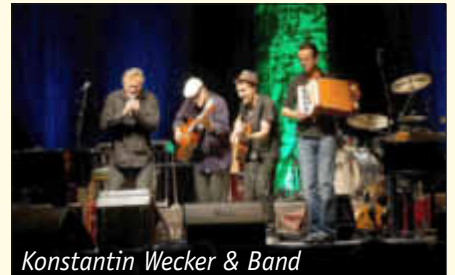
Konstantin Wecker & Band

Der Liedermacher, der die deutsche Musikszene seit über 4 Jahrzehnten mitprägt, ist sich selbst immer treu geblieben und wird so auch auf seiner aktuellen Tour den Menschen wieder Mut machen, sich zu empören, oder ganz einfach Mensch zu bleiben. Dies tut er mit wütenden und zärtlichen Tönen sowie traumhaft schönen Melodien. Konzertbeginn 20 Uhr, Einlass ab 19 Uhr, Karten ab 39.50 EUR bei der Tourist-Info am See, sowie allen Vorverkaufsstellen von www.ticketregional.de