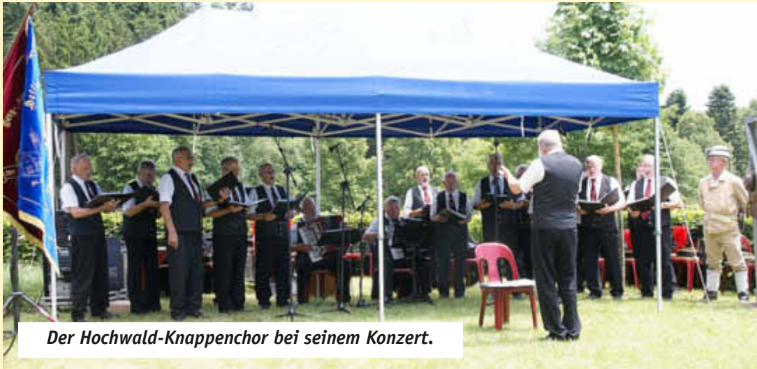
Der Hochwald-Knappenchor bei seinem Konzert.

Mit einem fast zwei-stündigen Programm bot der Chor, der 20 Mitglieder inklusive zweier Instrumentalisten umfasst, einen unterhaltsamen Nachmittag für das Publikum auf der Veranstaltungswiese und die Gäste auf der Bistrotterrasse. Dabei spannte sich der Bogen des Konzertes von Bergmannsliedern über