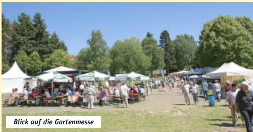
Blick auf die Gartenmesse

Am kommenden Wochenende beginnt der Festival - und Konzertreigen auf der großen Sommerbühne am See.