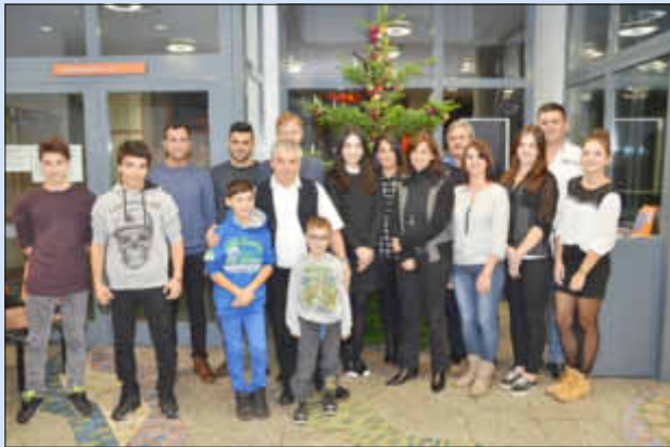
Die neu eingebürgerten Bürgerinnen und Bürger mit Landrätin Daniela Schlegel-Friedrich (6. von rechts) bei der Einbürgerungsfeier in Merzig.

16 Bürgerinnen und Bürger verschiedener Nationalitäten aus dem Landkreis Merzig-Wadern erhielten am Donnerstag, 5. Dezember, während einer Feierstunde im großen Sitzungssaal des Landratsamtes ihre Einbürgerungsurkunden von Landrätin Daniela Schlegel-Friedrich.