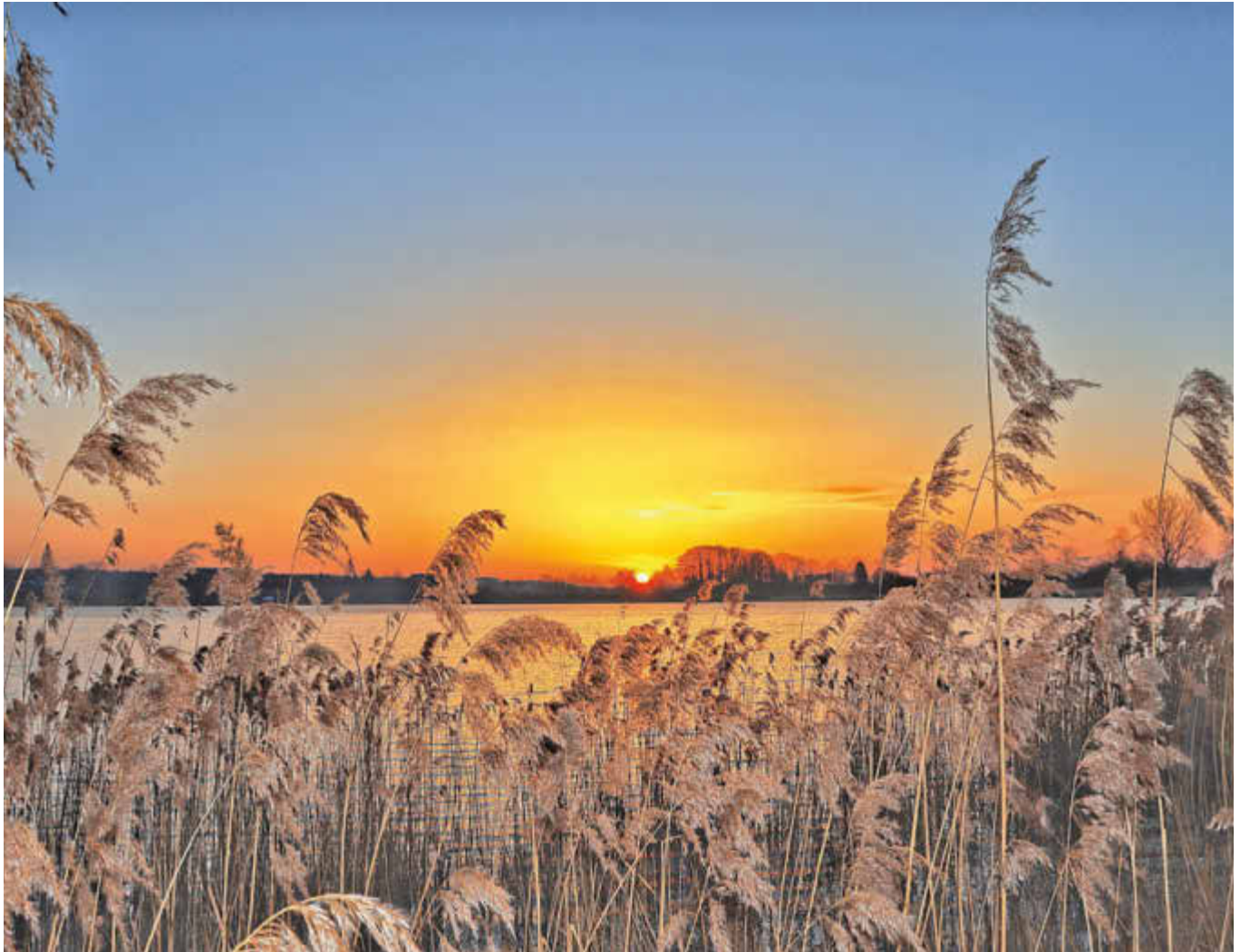
Sonnenaufgang am Stausee, Foto: Patrik Weißler