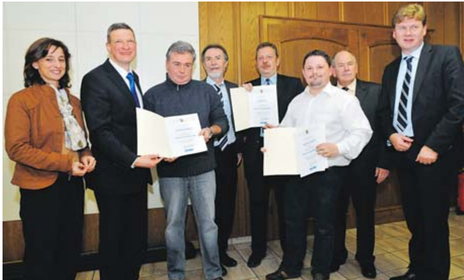
Ehrung der Retter durch Innenminister Stephan Toscani im Beisein von Landrätin Daniela Schlegel-Friedrich, Bürgermeister Lothar Christ und Bürgermeister Carsten Wiemann (Gemeinde Mettlach)

reiche Landes-, Kreis- und Kommunalpolitiker sowie Freunde und Verwandte. „Die große Präsenz der Vertreter des öffentlichen Lebens unterstreicht die Wertschätzung, die wir diesem Ereignis beimessen“, sagte Toscani. Die Rettungstat habe für alle Bürger einen vorbildlichen Charakter. „Eine öffentliche Belobigung soll Menschen zuteil werden, die anderen in einer Gefahr helfen oder beistehen“, erläuterte der Minister.