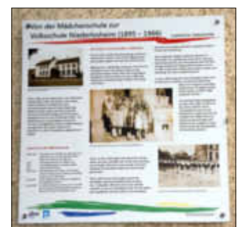
Die Geschichtstafeln: Pfarrkirche, alte Volksschule und der Neubau der Volksschule.