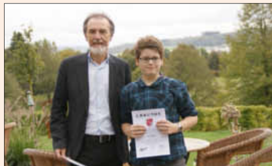
Bürgermeister Christ überreichte dem jungen Künstler eine Urkunde und ein Präsent der Gemeinde

Bürgermeister Lothar Christ zeigte sich zuversichtlich, dass das junge Talent bald auch in der Gemeinde Losheim am See mit einer musikalischen Darbietung zu sehen und zu hören sein wird.