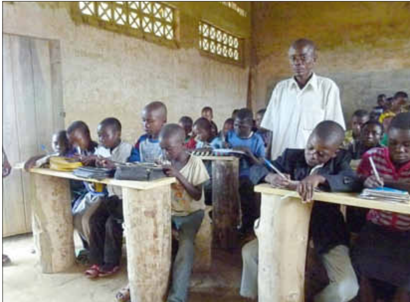
„Dank Losheimer Unterstützung lernen die Schüler der Grundschule EP Bolondo jetzt auf robusten Bänken und nicht mehr auf dem staubigen parasitenverseuchten Boden“