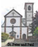
St. Peter und Paul

....ein Ort, um Gott zu begegnen - durch Gebet, Meditation und Stille.