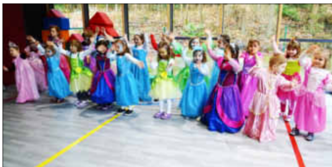
Die Prinzessinnen mit ihrem Tanz

Die Prinzessinnen führten ihren einstudierten Tanz vor, es gab einen Singkreis und ein Kasperletheater.