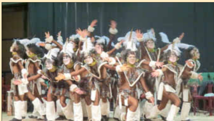
Dance-Teens der KG Losheim