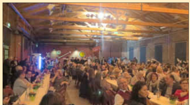
Blick in die Gästerunde

Losheim am See erfreue sich einer attraktiven und sensiblen Ehrenamtskultur, die sich in vielen Bereichen des Gemeinschaftslebens und gerade jetzt auch in der Flüchtlingsarbeit widerspiegeln, so die positive Bilanz des Bürgermeisters. Er bedankte sich für diesen vielseitigen und unermüdlichen Einsatz im bürgerschaftlichen Engagement.