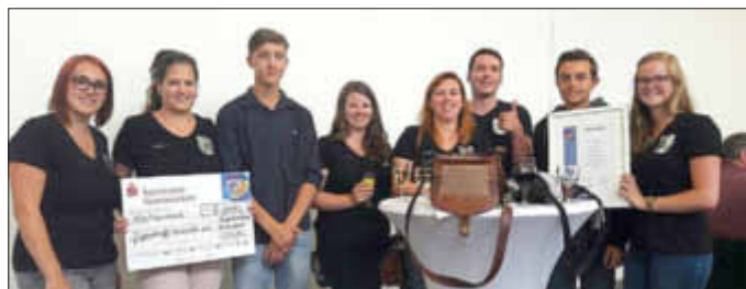
Jugendtreff Scheiden erhält den Förderpreis 2017

Der Jugendtreff Scheiden bedankt sich ganz herzlich bei der Saarländischen Landesregierung und der Landesarbeitsgemeinschaft PRO EHRENAMT e.V. für die Verleihung des diesjährigen Förderpreises Ehrenamt. Ein dickes Lob geht auch an alle Mitglieder und Fördermitglieder, ohne die der Förderpreis und das Preisgeld in Höhe von 1000€ undenkbar gewesen wären. Unser Dank gilt auch der Scheidener Dorfgemeinschaft und den einzelnen Vereinen, die uns bei diesem Weg unterstützt haben. Wir freuen uns auf die nächsten Jahre!