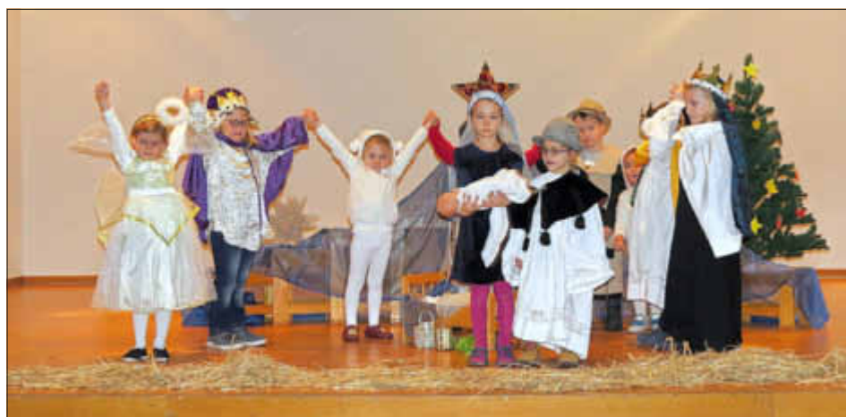
Krippenspiel der Kinder

Im Rahmen der besinnlichen Adventsfeier im entsprechend weihnachtlich geschmückten Bürgerhaus Bergen fand im Beisein der Kita-Kinder, ihrer Eltern und Erzieher sowie des Bürgermeisters und Vertretern des Gemeinderates sowie den Ortsvorstehern von Bergen, Scheiden und Waldhölzbach und weiteren Gästen auch die offizielle Übergabe und Vorstellung der durchgeführten Änderungs- und Sanierungsmaßnahmen der Kita-Räumlichkeiten statt.