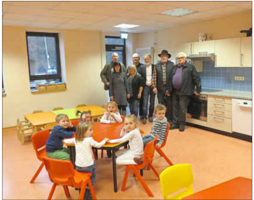
Zwischenstopp im Bistro beim Rundgang durch die neugestalteten Räumlichkeiten

wichtig und daher investiere sie seit Jahren in ihre Kitas und Schulen - mehr als 7. Mio. Euro in den vergangenen Jahren - , hob der Bürgermeister die Bestrebungen der Gemeinde hervor. Auch die besonderen Vergünstigungen der Familienkarte und das Engagement des Familienforums spiegelten die Familienfreundlichkeit der Kommune wieder, die im Jahr 2018 auch mit dem Landessiegel „Familienfreundliche Kommune“ ausgezeichnet werde. Das sei Freude und Verpflichtung zugleich für die Zukunft. „Das Wertvollste in einer Gesellschaft sind die Kinder, mit Ihnen gestalten wir die Zukunft“, erklärte sich Lothar Christ solidarisch mit dem Leitspruch der kommunalen Kitas. Neben allen an der Umsetzung der Maßnahme