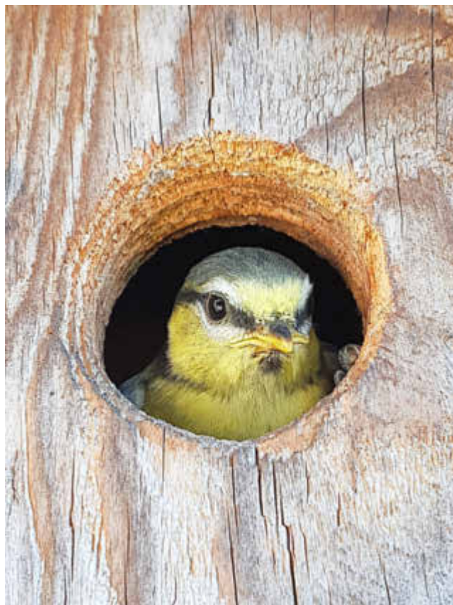
Eine achtsame Sicht auf die Umwelt öffnet den Blick für vermeintlich unscheinbare Naturerlebnisse – hier z.B. ein Foto einer jungen Blaumeise, das anlässlich des Foto-Wettbewerbes eingereicht wurde.

Und wir haben bemerkt, was viele Mitmenschen tagtäglich für unsere Gesellschaft beruflich leisten und wie wenig wir dieses Engagement zuvor bewusst wahrgenommen oder wertgeschätzt haben. Auf einmal droht die Schließung weiterer Krankenhäuser im ländlichen Raum. Die zuvor als Alltagshelden gefeierten Mitarbeiterinnen und Mitarbeiter müssen wie viele andere um ihre berufliche Perspektive bangen und das in einer Zeit, in der ein leistungsfähiges und flächendeckendes Gesundheitssystem extrem wichtig ist. Eltern stellten fest, welche wichtige gesellschaftliche Funktion Kitas und Schulen neben dem Bildungsauftrag schon immer übernommen haben und wie gerne die Kinder nach Wochen mit E-Learning und Homeschooling wieder in die Klassenräume zu Lehrern und Mitschülern zurückgehen. Wir bemerken, dass der Einzelhandel vor Ort unsere Unterstützung braucht und dass wir im Umkehrschluss regionale Produzenten vor der eigenen Haustür benötigen, wenn die weltweiten Lieferketten zusammenbrechen und die Globalisierung ihre Kehrseite offenbart.