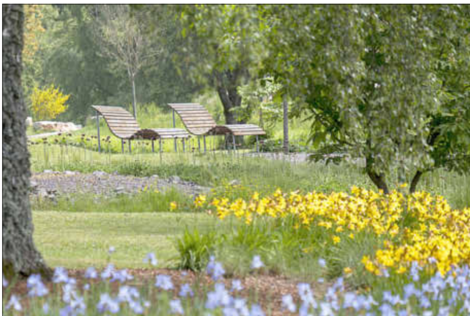
Achtsamkeit dient der Stressbewältigung und bildet einen Gegenpol zur Schnelllebigkeit des Alltages. Orte wie der SeeGarten laden zum Entspannen ein.

Freunden zu schwenken, ein leckeres Essen im Restaurant zu genießen oder einen Film im Kino anzusehen, von jetzt auf gleich nicht mehr möglich sind. Wir haben aber auch erfahren, dass ein Spaziergang in unserer schönen Natur ebenfalls ein wertvoller Alltagsmoment sein kann, dass ein Gespräch mit dem Nachbarn auf einmal viel tiefgründiger sein kann, dass gemeinsame Zeit mit Familie und Freunden keine Selbstverständlichkeit ist.