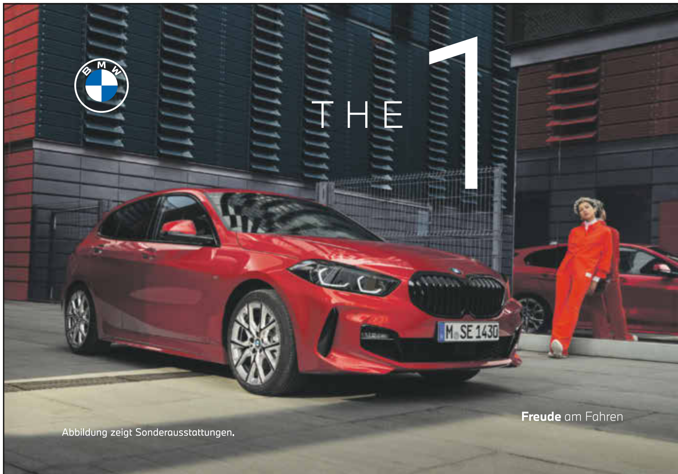
Abbildung zeigt Sonderausstattungen.