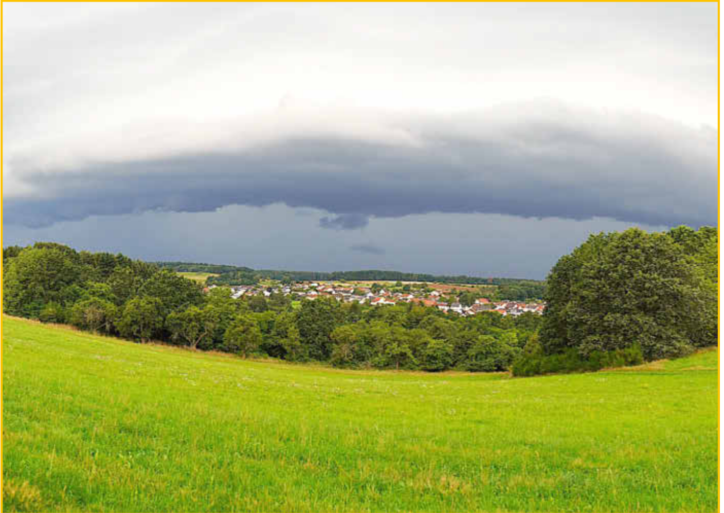
Gewitterwolken über Mitlosheim