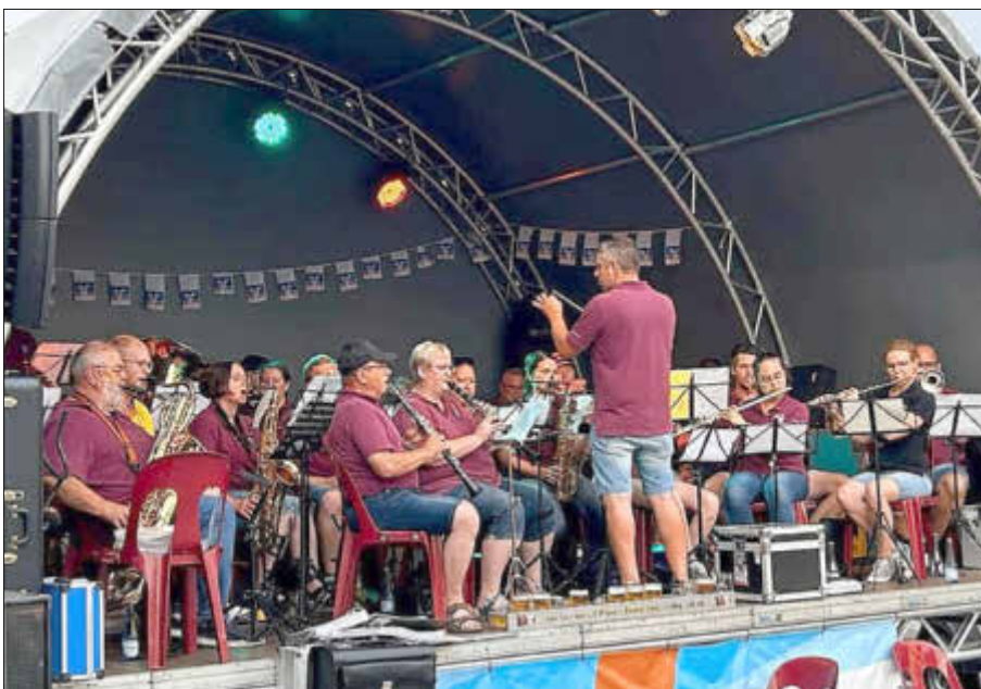
Das Orchester des MV Hausbach in Aktion bei einem Auftritt bei der Losheimer Kirmes.

Raffael Kunz auf dem Programm. Zwei furiose Originalkompositionen des Niederländers Jacob de Haan werden mit den Titeln Arsenal und Ross Roy den Melodienreigen eröffnen. Mit den Titeln Wild West und The Lion King werden weltbekannte Filmmelodien geboten. Mit Solostücken für Gesang und Flügelhorn, aber auch dem klassischen Marsch sowie echter Rockmusik von Bon Jovi oder Kulthits aus den 80ern sollte für jeden Musikgeschmack beim Konzert in Hausbach bei freiem Eintritt etwas dabei sein. Bei Regen kann das Konzert notfalls ins Bürgerhaus verlegt werden. Die rund 40 Musikerinnen und Musiker des MV freuen sich, zusammen mit dem Losheimer Bürgermeister Helmut Harth die neue Bühne der Bevölkerung am kommenden Sonntag vorstellen zu dürfen.