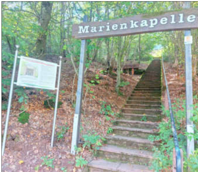
Die neue Info-Tafel befindet sich am Eingangportal, von dem aus eine steile Treppe zur Marienkapelle hinaufführt.