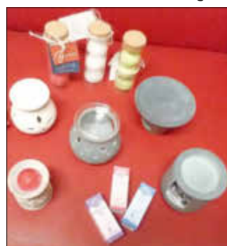
Sie finden uns in der Weiskirchener Str. 24 in 66679 Losheim am See. Geöffnet haben wir donnerstags und freitags von 15 bis 18 Uhr und samstags von 10 bis 12 Uhr .

Genießen Sie die Schokoladen beim Wohlgeruch der Duftlampen , in klaren Formen oder verspielt aus Speckstein in Indien gefertigt, befüllt mit Duftölen oder tropffreien Duftthalbkugeln. Tara setzt sich für die Würde der Ärmsten in den Slums ein: faire Bezahlung, medizinische Versorgung, Frauenrechte, Kinderbetreuung, Bildung und Umweltschutz.