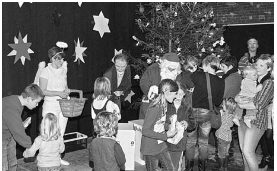
Gemeinsam mit dem Bürgermeister und seinem Engel teilte der Weihnachtsmann an alle Kinder Weckmänner aus.