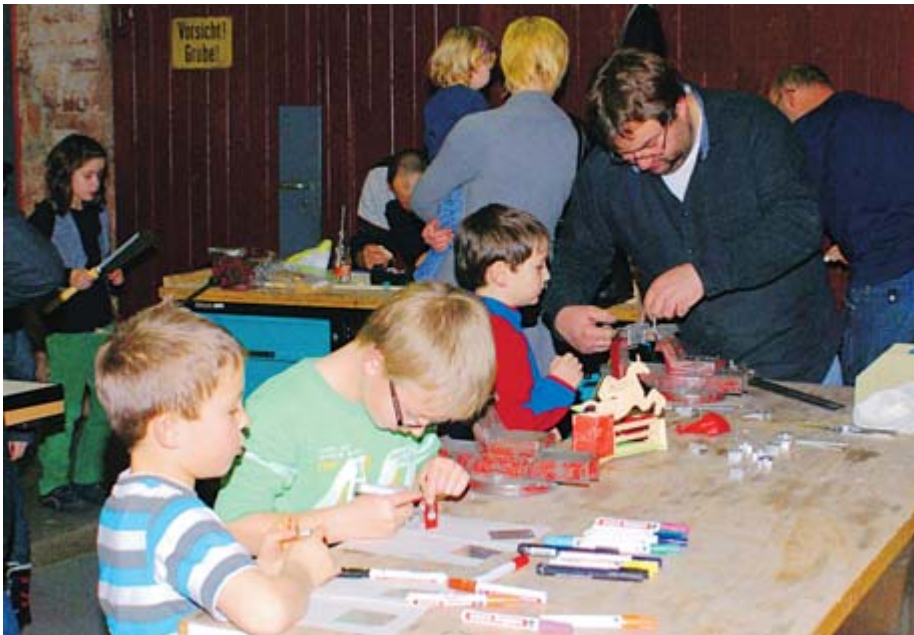
Mit eigenen Bastelarbeiten konnten sich die Kinder bei der Losheimer Arbeitsmarktinitiative (LAI) und dem Kreisjugendamt beschäftigen.

Während des gesamten Nachmittags durfte außerdem eifrig gebastelt und gewerkt werden. An großen Tischen standen die Erzieherinnen aus den gemeindlichen Kindergärten sowie Mit-