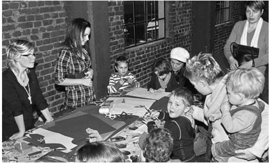
Auch die kommunalen Kindergärten ...