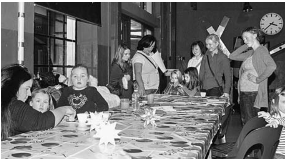
... und die Bediensteten der Verwaltung brachten sich in die Veranstaltung mit ein.