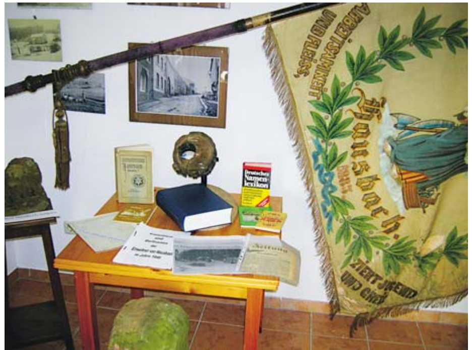
Die Fotos zeigen Eindrücke von dem neuen Hausbacher Dorfarchiv ...

Der Erfolg dieser Bemühungen von „Bautrupp“, Leihgebern und Arbeitsgruppe zeigte sich schon darin, dass ortsbewusste Bürger seither neue Fotos, Totenbilder und Zeitungsausschnitte zur Verfügung stellten. Die Arbeitsgruppe wird mit weiteren Tagen der „offenen Tür“ versuchen, den Hausbachern ihre besondere Ortsgeschichte näherzubringen.