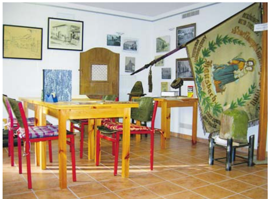
... das im Keller der Filiationkirche untergebracht ist.