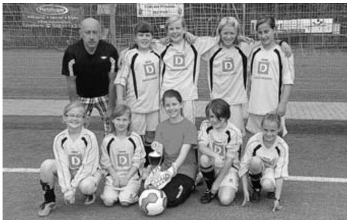
Die Mädchenmannschaft der Grundschule Losheim erreichte auf Landesebene ...

Endrunde der Grundschulmeisterschaften im Mädchenfußball: An den Grundschulmeisterschaften im Mädchenfußball haben in diesem Jahr 26 Mannschaften aus saarländischen Grundschulen teilgenommen. Für die Endrunde am 19. Juni in Eppelborn hatten sich die besten Mannschaften des Saarlands qualifiziert.