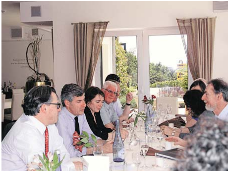
Gedankenaustausch beim Mittagstisch

Einladung zu einem entsprechenden Gegenbesuch trat die Delegation am Spätnachmittag die Heimreise an.