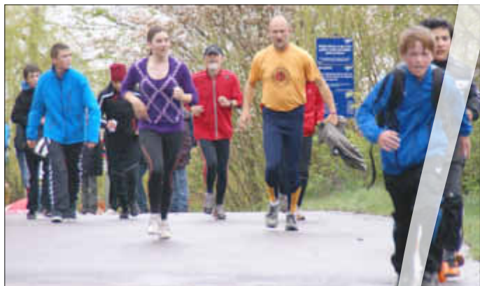
Im September: Laufend und walkend waren die Schülerinnen und Schüler der Peter-Dewes-Gesamtschule mit den Gästen und Lehrern unterwegs rund um den Stausee.

Bis zum nächsten Lauf können Spenden jederzeit und von jedermann auf das Schulkonto, Stichwort „Run for help“, Kto.Nr.24210 bei der Volksbank Untere Saar e.G. (BLZ 593 922 00), eingezahlt werden. - - -