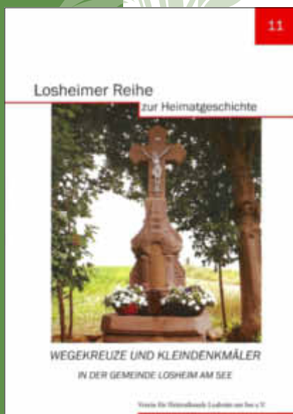
Die neue Broschüre des Heimatvereins im Rahmen der Losheimer Reihe zur Heimatgeschichte „Wegekreuze und Kleindenkmäler in der Gemeinde Losheim am See“

Die Broschüre kann ab sofort in den Buchhandlungen im Kreis für 10,00 Euro erstanden werden. Gedruckt wurden 500 Exemplare. - - -