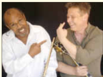
Ro Gebhard & Burdette Becks

Am Samstag, dem 12. April gastieren Ro Gebhard und Burdette Becks um 20 Uhr im Rahmen ihrer Unplugged Masters-Tour 2014 im Bistro des Park der Vierjahreszeiten am Stausee Losheim.