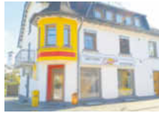
Unser Hauptgeschäft in Hausbach