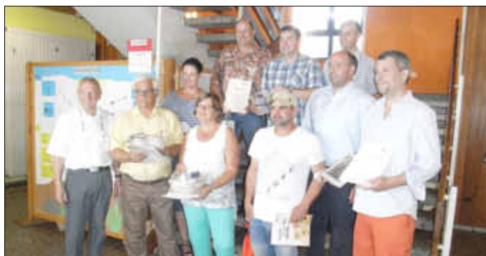
Blutspendejubilare in Losheim