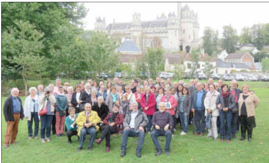
Gelungenes Abschlussfoto mit Blick auf die Schlossanlage in Pierrefonds

Mit einem gemeinsamen Mittagessen in der wunderschön gelegenen Stadt Pierrefonds fand mit Blick auf die ursprünglich aus dem Mittelalter stammende Schlossanlage das Partnerschaftstreffen einen gelungenen Abschluss.