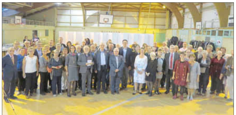
Offizielles Gruppenfoto in La Croix Saint Ouen