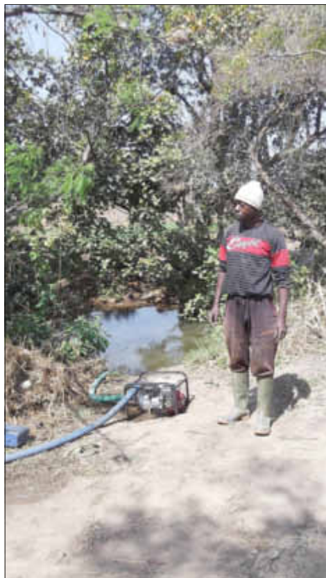
Bewässerungsprojekt in Copargo

Seit dem Jahr 2009 unterhält die Gemeinde Losheim am See eine Partnerschaft der Gemeinde Copargo im westafrikanischen Land Benin. Der Verein Entwicklungsförderung Benin e.V. (EFB) organisiert in Kooperation mit der Gemeinde Förderprojekte in Copargo in den Bereichen Gesundheit, Bildung und Landwirtschaft. Pro Jahr fließen mehr als 20.000 € an Spendengeldern in Projekte nach Copargo.