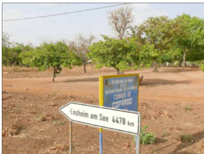
Straßenschild in Copargo

Bürgermeister Ignace Ourou wurde aus diesem Grund auf die Weltklimakonferenz nach Bonn eingeladen und dort mit einem Förderpreis für das Landwirtschaftsprojekt ausgezeichnet. Im Anschluss wurde er für 3 Tage in der Gemeinde Losheim am See und in Homburg, wo er