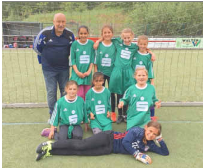
Die erfolgreiche Mädchen-Fußballmannschaft der Grundschule Losheim mit ihrem Trainer.

Gespielt wurde in einer Vierergruppe im Modus „Jeder gegen Jeden“ und nur der Gruppenerste qualifizierte sich für die Endrunde.