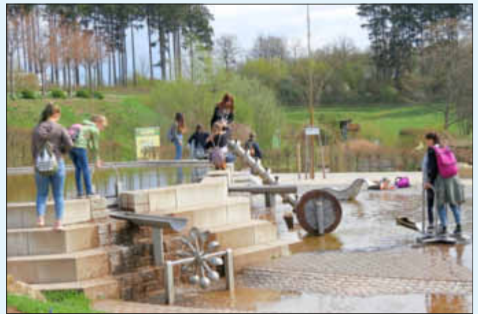
Aktiver Schüleraustausch am Wasserspielplatz