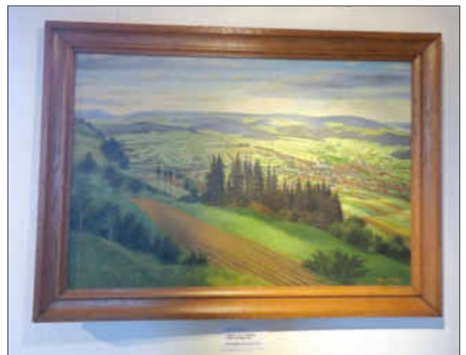
Losheim vor dem 2. Weltkrieg (Sicht vom Galgenberg)