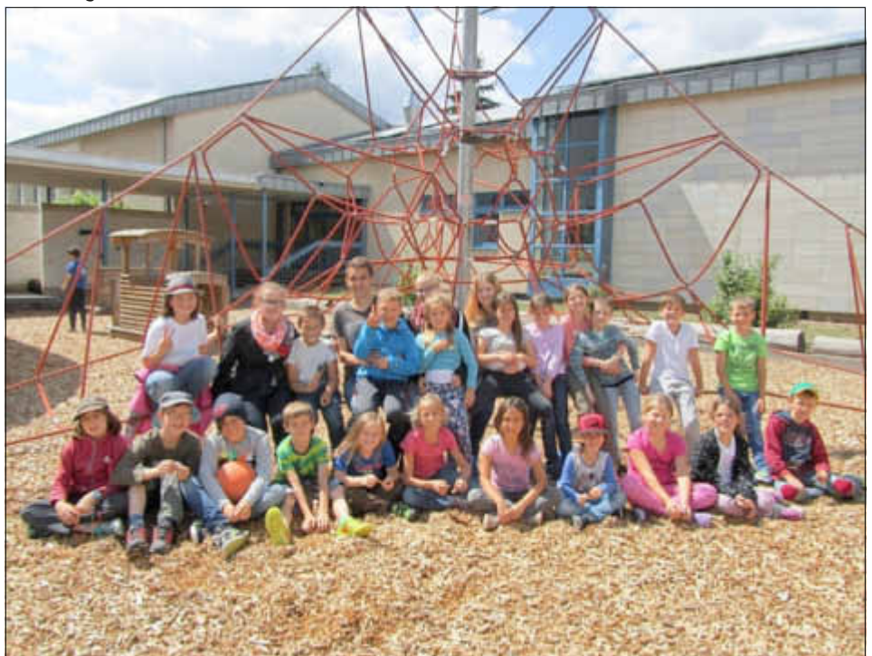
Bei den Kindertagen stehen gute Laune und Spaß auf dem Programm

An der Ferienfreizeit teilnehmen können Kinder im Alter von sechs bis zehn Jahren. Die Ferienfreizeit in der Gemeinschaftsschule Losheim beginnt um 8 Uhr und endet um 17 Uhr, ein Bustransfer aus den Ortsteilen der Gemeinde Losheim am See wird angeboten. Die Ferienfreizeit kostet 60 Euro, inklusive Verpflegung, Betreuung, Materialkosten, Bustransfer innerhalb der Gemeinde Losheim am See. Das Anmeldeformular gibt es auf der Website des Landkreises Merzig-Wadern zum Download www.merzig-wadern.de (Rubrik: Kinder und Jugend) Infos und Anmeldung bei Kerstin Jäger, Jugendbüro Losheim, Saarbrücker Straße 37, 66679 Losheim am See, Tel. (0 68 72) 77 99, Mobil (0170) 18 49 648, E-Mail an jugendbuero-losheim@merzig-wadern.de