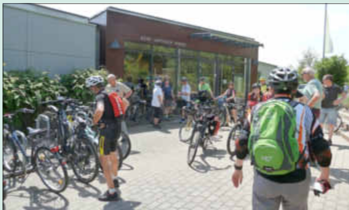
Auftakt der Aktion Stadtradeln am Bistro des Seegartens in Losheim

Während des Aktionszeitraumes von 3 Wochen sind BürgerInnen, Schulen, Vereine, Betriebe, Verwaltungen und Kommunalparlamente dazu eingeladen Teams zu bilden und „Fahrrad-Kilometer“ sammeln. Dazu zählen auch Pedelecs. So soll auf der einen Seite aktiv CO 2 vermieden werden und zum anderen dazu animiert werden die Lust und den Spaß am Radeln in Alltag und Freizeit zu entdecken. Die Kampagne startete am 26.05. mit einer gemeinsamen Radtour als kreisweitem Auftakt. Knapp 50 Radfahrer nutzten den neu ausgebauten Radweg nach Bachem. Auf der Internetseite der Gemeinde finden sie den Link zu weiteren Informationen und natürlich zur Internetseite www.stadtradeln.de . Voraussetzung für die aktive Teilnahme ist die