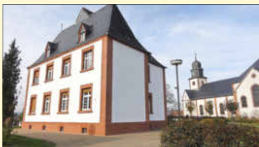
Das Pfarrhaus in Wahlen.

In unserem Artikel zur Sanierung der Treppe der Wahlener Kirche entstand der Eindruck, das historische Pfarrhaus in Wahlen sei ebenfalls sanierungsbedürftig und müsse in den kommenden Jahren mit Spenden wieder in Schuss gebracht werden. Dies entspricht jedoch keineswegs den Tatsachen, denn schon heute erstrahlt das denkmalgeschützte Gebäude aus dem Jahr 1907 in neuem Glanz – und dies dank des großen ehrenamtlichen Engagements einiger Wahlener Bürgerinnen und Bürger. Diese sanierten im Zeitraum von 2010 bis 2014 unter der Federführung des Pfarrverwaltungsrates in kompletter Eigenregie das Bauwerk ohne finanzielle Unterstützung des Bistums oder des Landes. Mittlerweile zeichnet sich der St. Helena Förderverein Wahlen verantwortlich, der sich ebenfalls um