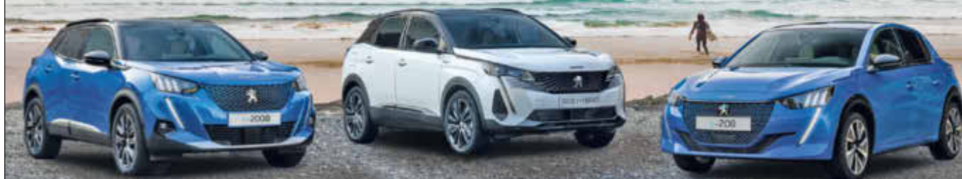
Abb. zeigt nicht angebotenes Beispielfahrzeug.