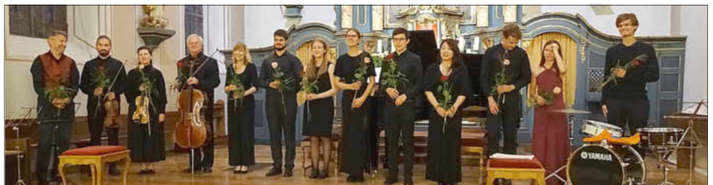
8 junge Musikerinnen und Musiker mit ihren 3 Dozenten