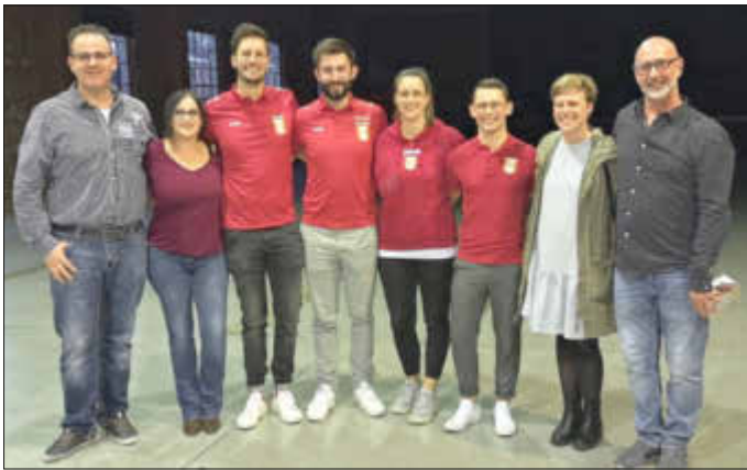
Vorstand der KG Rot-Weiß Losheim