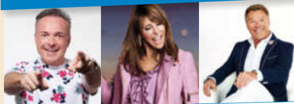
Tim Toupet, Ireen Sheer und Patrick Lindner