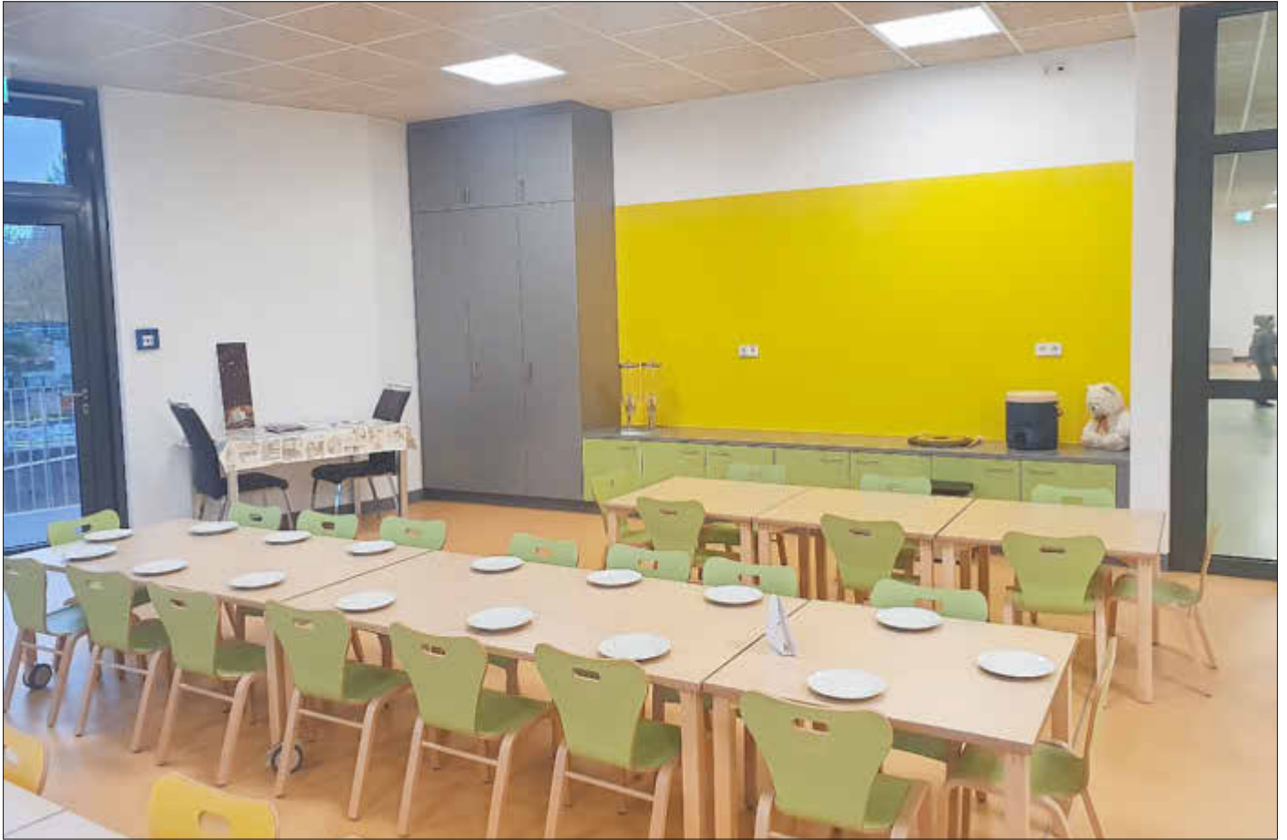
Essensraum im neuen Erweiterungsbau der Kita „Villa Regenbogen“

Im zweiten Teil unseres Jahresrückblickes erfahren Sie in einer Übersicht, welche Bau- und Infrastrukturmaßnahmen im Jahr 2021 in der Gemeinde Losheim am See umgesetzt wurden und welche finanziellen Investitionen diese mit sich brachten. Ebenso geben wir einen Ausblick auf die geplanten Maßnahmen im Jahr 2022. Auf die Investitionen im Stauseeumfeld gehen wir in einem späteren Artikel ein.