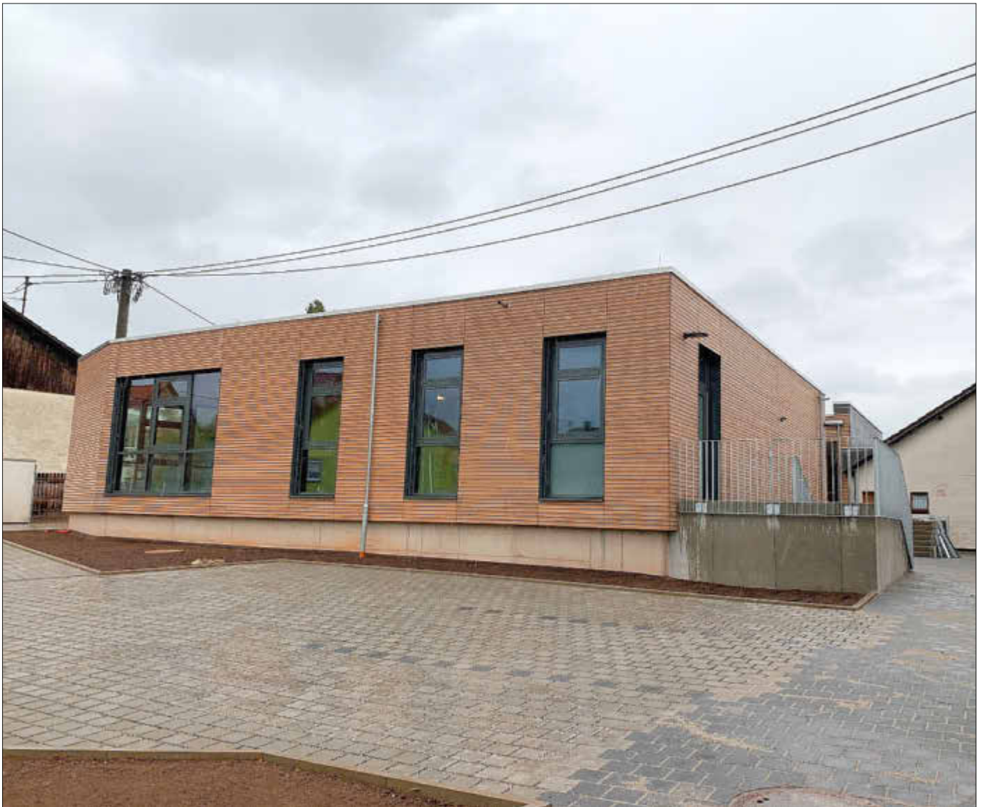
Blick auf den neugebauten Erweiterungsbau der Kita „Villa Regenbogen“ in Losheim