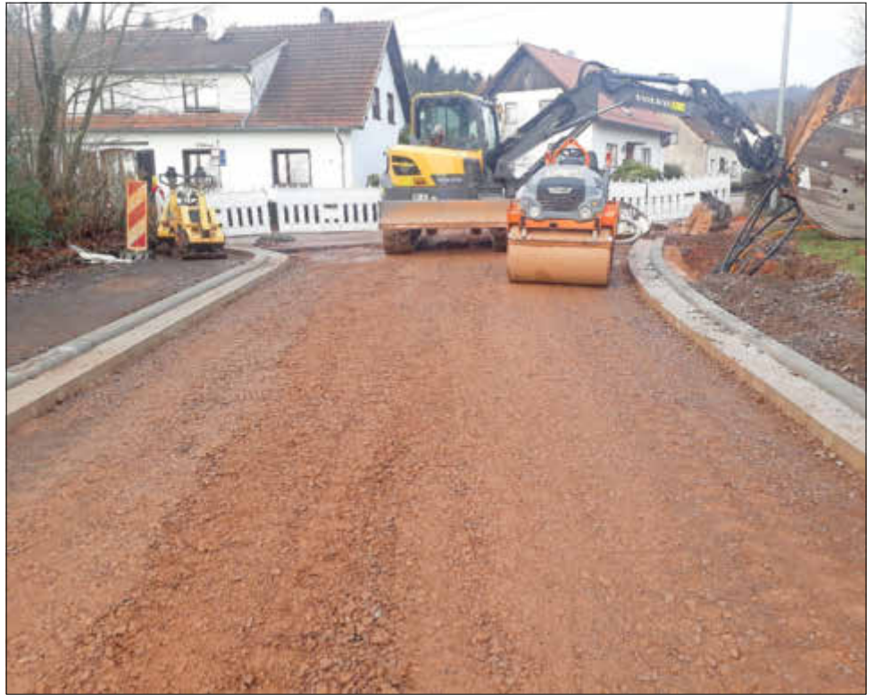
Kanalbau-Arbeiten in Bergen kurz vor dem Abschluss

In der nächsten Ausgabe geht es weiter mit dem dritten Teil unserer „Jahresrückblick-Serie“ mit einem Einblick in die vielfältige Arbeit des Eigenbetriebs Touristik, Freizeit und Kultur. Darin werden wir auch auf die Baumaßnahmen im Umfeld des Stausees eingehen.